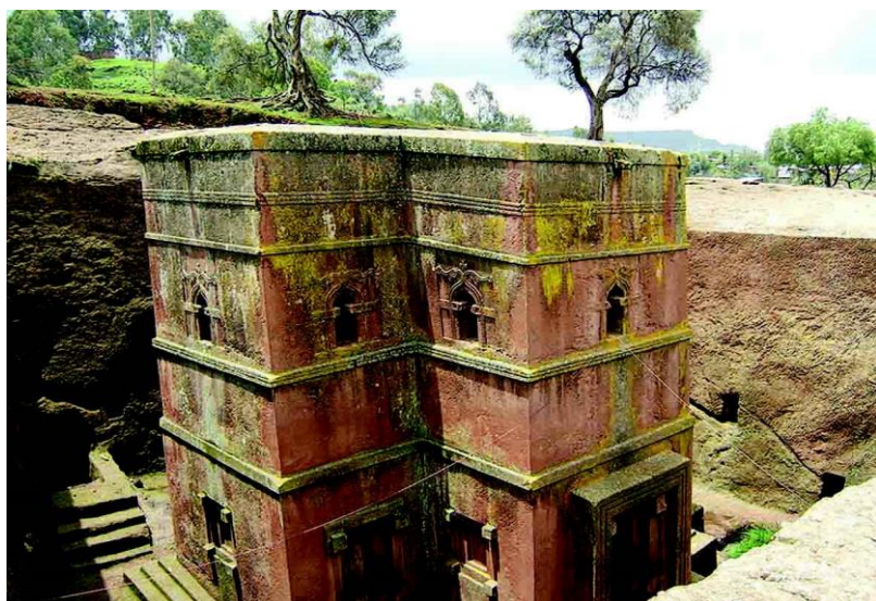
拉里贝拉岩石教堂

埃塞俄比亚居民中45%信奉埃塞俄比亚正教（基督教一性论教派），40%-45%信奉伊斯兰教，5%信奉新教，其余信奉原始宗教。