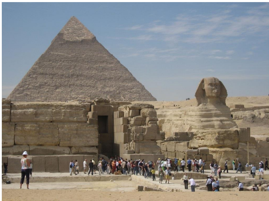
金字塔和狮身人面像

埃及是世界四大文明古国之一。公元前3200年，美尼斯统一埃及建立了第一个奴隶制国家，此后经历了早王国、古王国、中王国、新王国和后王朝时期，共30个王朝。古王国开始大规模建金字塔。中王国经济发展、文艺复兴。新王国生产力显著提高，开始对外扩张，成为军事帝国。后王朝时期，内乱频繁，外患不断，国力日衰。公元前525年，埃及成为波斯帝国的一个行省。在此后的一千多年间，埃及相继被希腊和罗马征服。公元641年，阿拉伯人入侵，埃及逐渐阿拉伯化，成为伊斯兰教一个重要中心。1517年被土耳其人征服，成为奥斯曼帝国的行省。1882年英军占领后成为英国“保护国”。